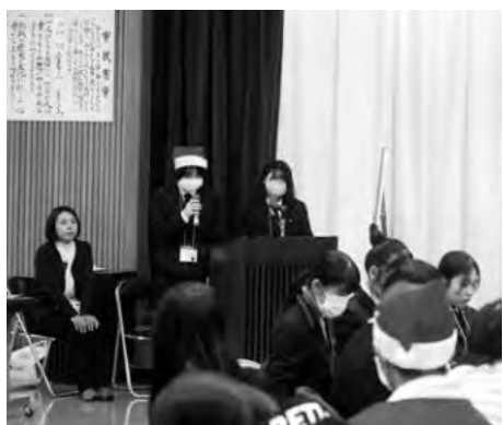
ファイブハーツ クリスマス交流会