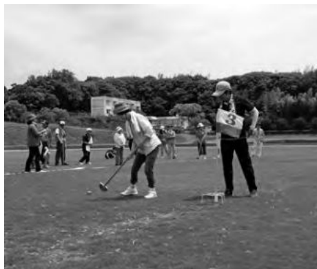
益田市障がい者スポーツ大会