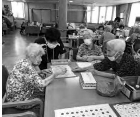
サマーボランティアスクール