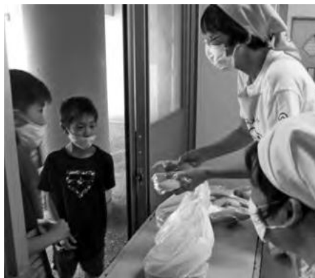
たかつ子ども食堂