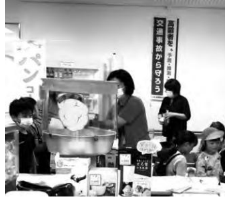
地域交流推進備品 わたがし機(匹見)