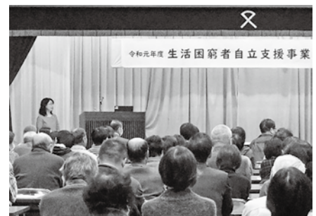
<生活困窮者自立支援事業講演会>