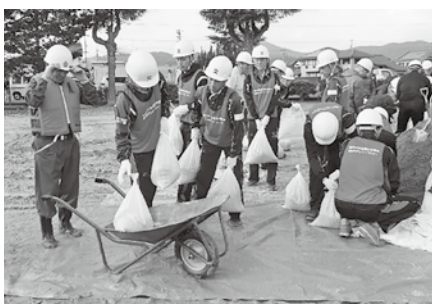
<災害ボランティアセンター設置運営訓練>