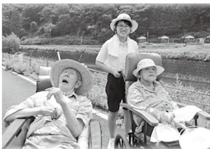
<サマーボランティアスクール>