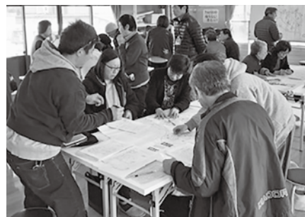
<支え合いマップづくり>