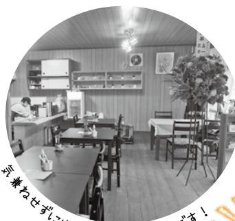
気兼ねせずにくつろげるお店です！