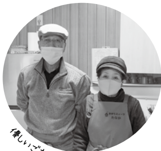
優しいご夫妻が迎えてくれます