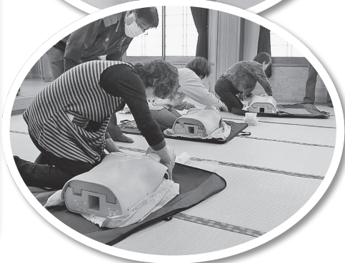
2月に行われた防災と救急法についての研修会の様子