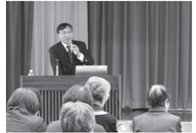
1月29日(金) 益田市総合福祉センターにて

今回の研修会を機会に、たくさんのボランティアさんに益田市ボランティア連絡会に参加していただければと思います。