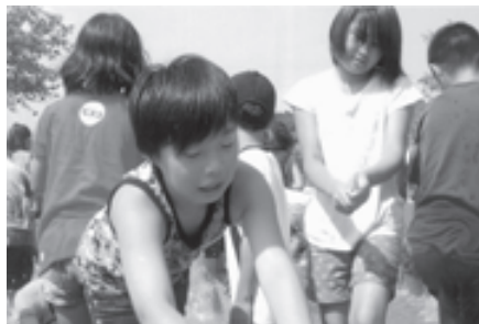
（鮎とウナギつかみの一場面）

地域の皆さん、ちょっとハウスに立ち寄って、子ども達とふれあう楽しさを味わってみられませんか？