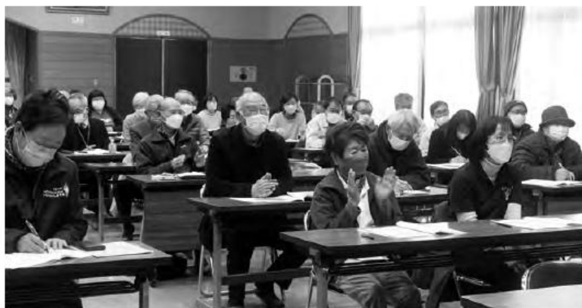
▲楽しく分かりやすい話で、会場は終始笑いに包まれていました