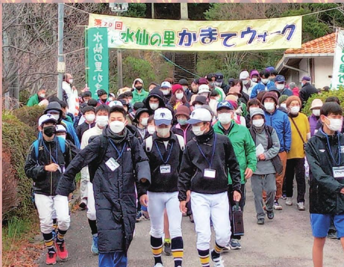
録手地区「第20回 水仙の里かまてウォーク」(詳しくは11ページの記事をご覧ください)